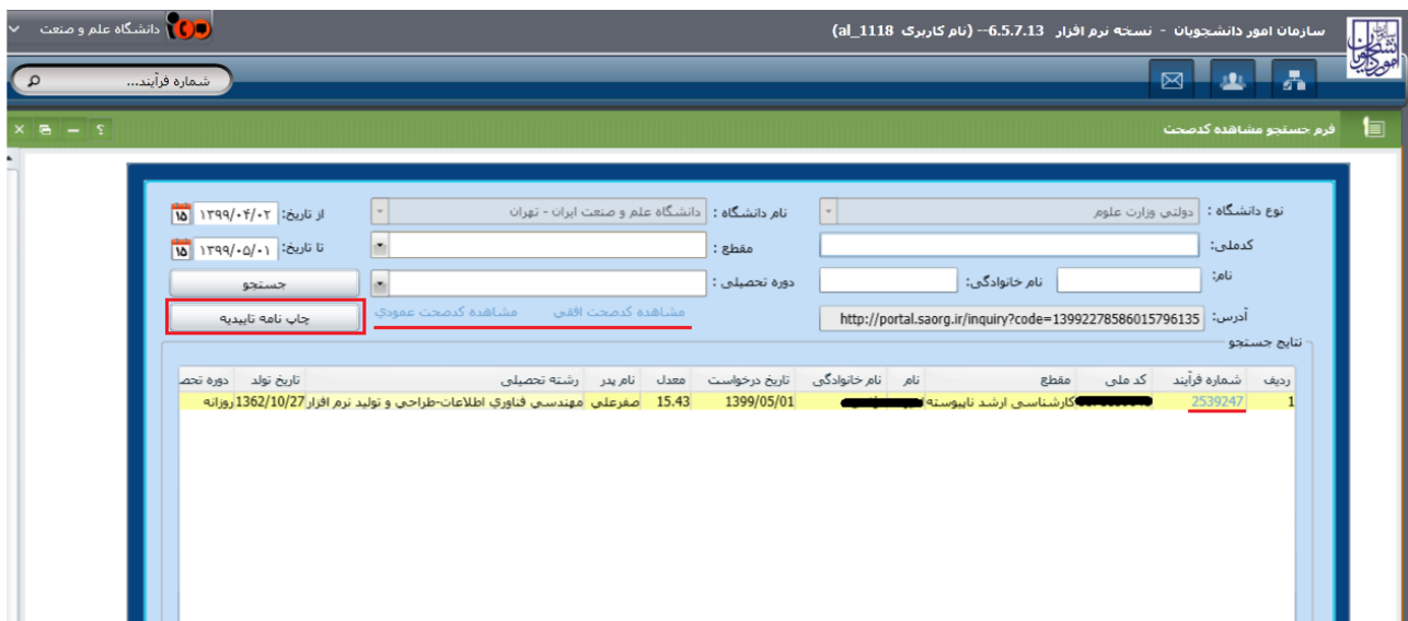
تصویر ۶- جستجو فرآیند مورد نظر

همچنین با انتخاب رکورد مورد نظر نیز می توانید نسبت به چاپ یا مشاهده کد صحت از طریق کلید چاپ تاییدیه یا لینک های موجود بر روی فرم اقدام نمایید. (تصویر ۶)