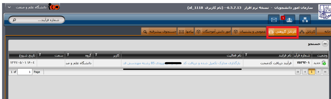
تصویر ۸- بروز خطا هنگام بارگذاری

در صورتی که نوع درخواست دانشنامه باشد پس از ثبت درخواست فرآیند مجدد در کارتابل گروهی شما جهت بارگذاری مدارک ریز نمرات و ارزشنامه قرار می‌گیرد. جهت مشاهده فرم فرآیند بر روی لینک آبی رنگ کلیک کنید. (تصویر ۸)