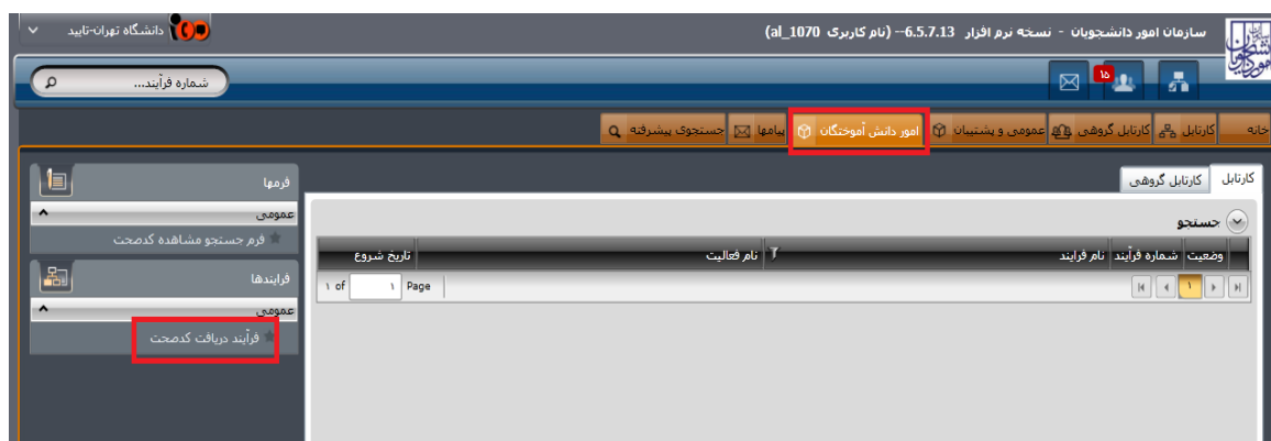
تصویر ۲- انتخاب فرآیند در سربرگ امور دانش آموزان

پس از ورود، از لیست فرآیندها در سربرگ امور دانش آموزان، فرآیند دریافت کد صحت را انتخاب و با کلیک بر روی آن، فرم مربوطه را باز کنید. (تصویر ۲)