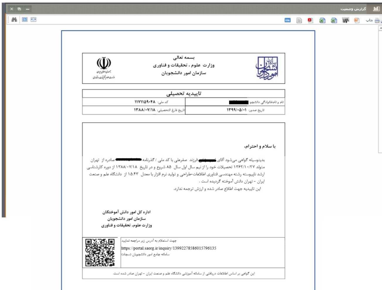
تصویر ۷- تاییدیه تحصیلی

در صورتی که نوع درخواست دانشنامه باشد پس از ثبت درخواست فرآیند مجدد در کارتابل گروهی شما جهت بارگذاری مدارک ریز نمرات و ارزشنامه قرار می‌گیرد. جهت مشاهده فرم فرآیند بر روی لینک آبی رنگ کلیک کنید. (تصویر ۸)