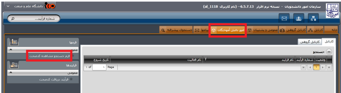
تصویر ۵- فرم جستجو مشاهده کدصحت

با فیلترهای موجود در تصویر ذیل می توانید نسبت به جستجو فرد مورد نظر اقدام و با کلیک بر روی شماره فرآیند کد صحت را مشاهده و چاپ نمایید.