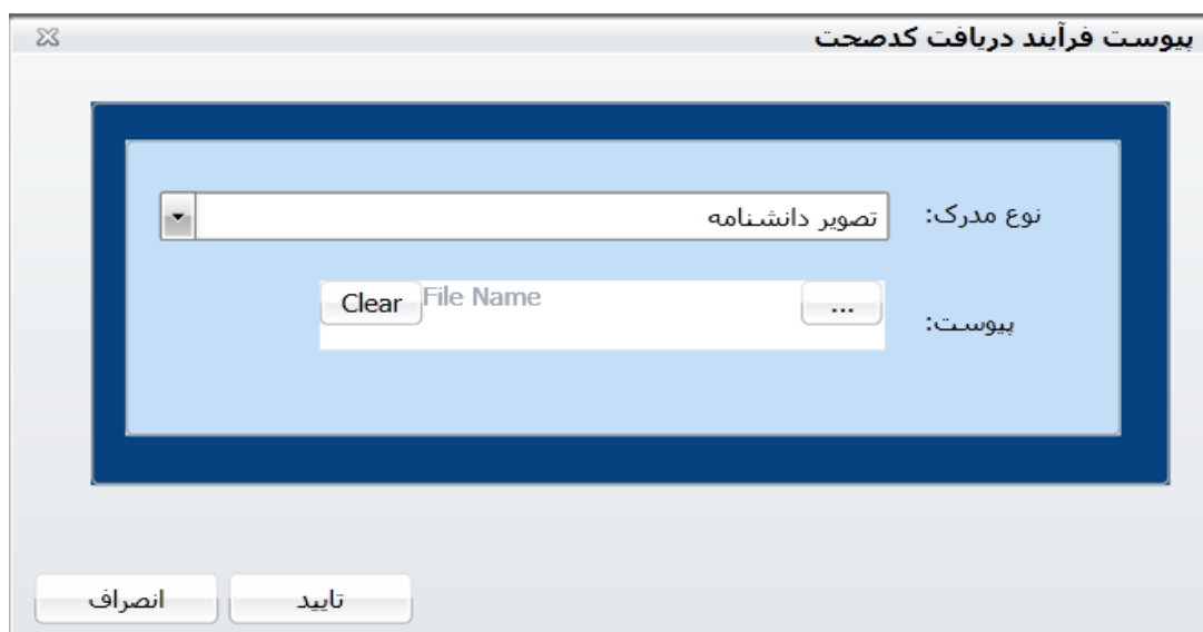
تصویر ۲- پیوست فرآیند دریافت کدصحت